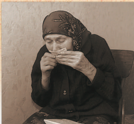
Вісточка від батька... 2010 р.

Книга реєстрації поштової кореспонденції МКНМІВВВ. – В/х № 224 від 03.04.2010 р.