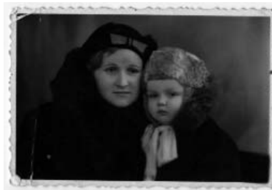
Фото вкрито в лист. Розмір: 5,6x8,5. Фонди МКНМІВВВ. – КН-248052. – Ф-32290.