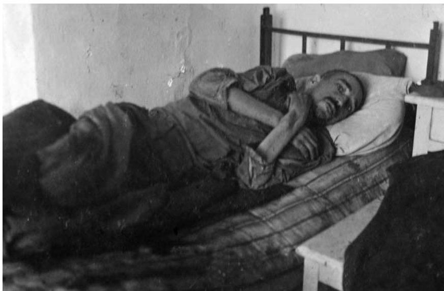
№ 2. Один із колишніх в'язнів «Грослазарету». м. Славута. 1944 р.