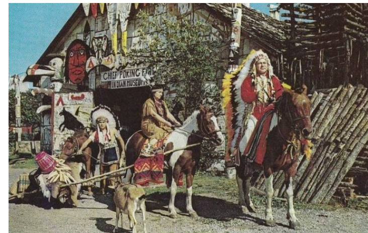
Вождь Пронизуючий Вогонь із родиною. Канадська листівка. 1950-ті рр.