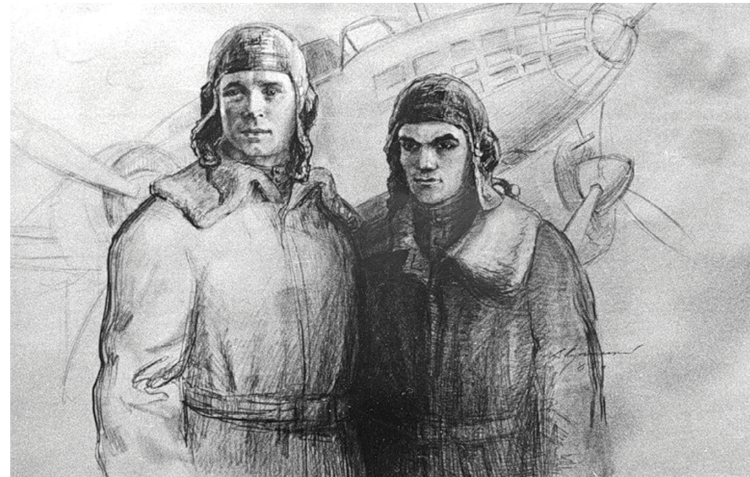
В. Лужецький. Герої Радянського Союзу Іван Даценко та Григорій Безобразов.

Льотчик лейтенант Іван Даценко воював у складі 93-го далекобомбардувального авіаційного полку (з 12 серпня 1941 р. – 98-й далекобомбардувальний авіаційний полк; з березня 1942 р. – 752-й авіаційний полк далекої дії; з 26 березня 1943 р. – 10-й гвардійський авіаційний полк далекої дії).