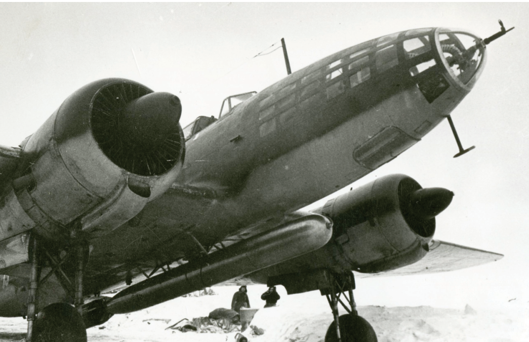
Літак Іл-4 (ДБ-3Ф). 1940-ві рр.

І Чкаловське військово-авіаційне училище льотчиків ім. К.Є. Ворошилова (м. Чкалов, нині Оренбург, РФ).