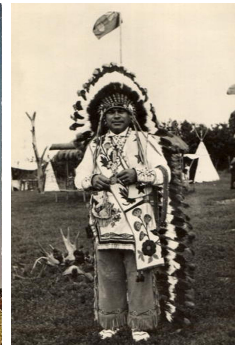
Вождь Пронизуючий Вогонь. Канадські листівки. 1950 – 1960 рр.

Про те, що він Герой Радянського Союзу, вождь танцюристу не повідомляв, у цьому його запевнив професор Монреальського університету, який був свідком розмови.